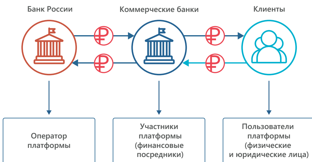
Схема 1. Роли в платформе цифрового рубля

Цифровой рубль будет храниться на цифровых счетах граждан и организаций – цифровых кошельках, открытых на платформе Банка России и не привязанных к какому-то конкретному банку.