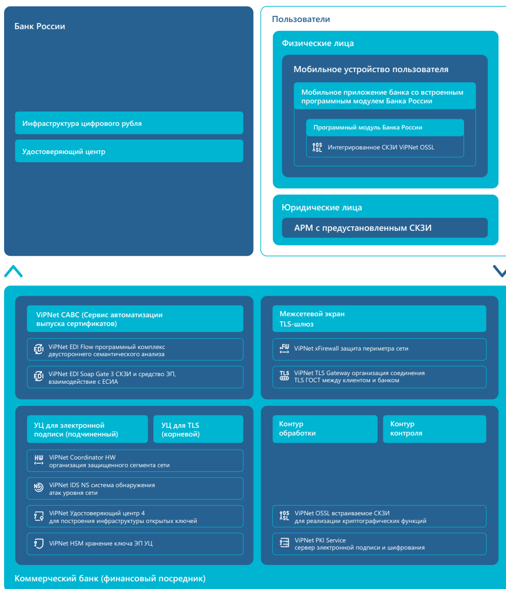
Схема 2. Продукты VipNet для защиты платформы цифрового рубля